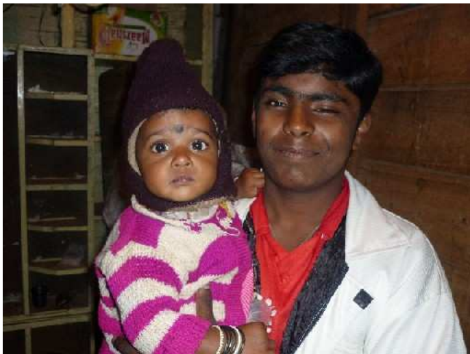
Alwin (mit der kleinen Tochter eines Gemueseverkaeufers auf dem Markt, der uns kurzerhand in seinen Stand bat, um Tee zu trinken und mit seinen Kindern zu spielen.)

kann ich sagen, dass ich bereits jedem der vielen interessanten Buchstaben einen Laut zuordnen kann und mich nun darin uebe, sie zu Woertern zusammenzusetzen. Mit Freude uebe ich daneben das Malen, aeh... Schreiben der neuartigen Zeichen. Als Ergebnis der bisherigen Stunden kann ich Gespraechе von bis zu drei Saetzen Laenge fuehren – deren Aufbau (und Inhalt) sich zwar auffallend oft aehneln, aber naja. (Die Kunst besteht einfach darin, mir oft genug neue Gespraechspartner zu suchen! ☺) Ausserdem kann ich verschiedene Begriffe und Wendungen des taeglichen Lebens gebrauchen: Baum, Blume, Regen, Sonne, ... ‚Ich esse‘, ‚Ich werde essen‘, ‚Ich habe gegessen‘, ... ‚Erzaehl mir von deiner Familie‘ usw. Und ich koennte – um ein rein zufaelliges Beispiel zu waehlen – eine Ratte mit ihrem korrekten tamilischen Namen ansprechen. (Das kann nie schaden.) Kurzum, es geht voran.