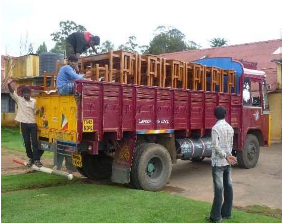
Auslieferung der fertigen Baenke an eine Schule in der Region. (Man beachte die Aufschrift ‚Labour is Love‘, die ueber dem Hinterrad prangt.)

Allen Schwierigkeiten zum Trotz sind Schueler und Lehrer mit ganzem Herzen und Froehlichkeit bei der Sache und arbeiten motiviert und schier unermuedlich. Gerade Letzteres konnte ich immer wieder beobachten, wenn angesichts dringender Auftraege Sonntags- und Nachtschichten eingelegt wurden.