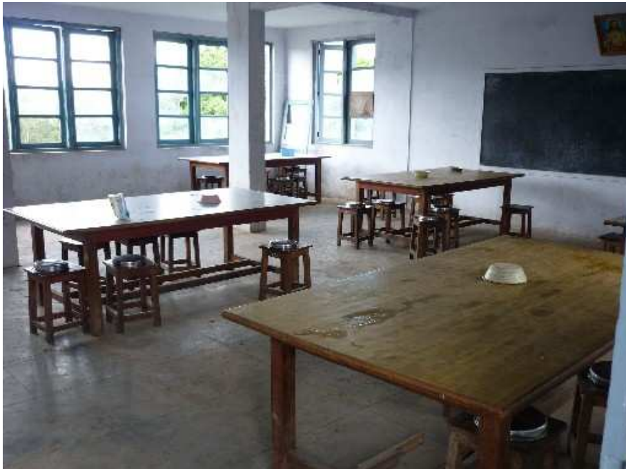
Der Speisesaal der Hostel Boys. Das Geschirr liegt stets auf den Hockern bereit.

Es ist also nicht nur die fachliche Kompetenz, sondern auch die Bewusstwerdung der eigenen Würde, die zum Lernstoff der Schüler gehört. Und dies ist die mit Abstand schwierigste Lektion, da sie oft die Erfahrungen eines ganzen bisherigen Lebens auf den Kopf stellt. Ausserdem kann man kaum sagen, wie lange sich die Jungs später daran erinnern werden (dürfen) – wenn die Gesellschaft sie wieder in ihre alten Rollen drängen und ihnen den Makel der Unberührbarkeit anheften wird. Aber vielleicht kann man sagen, dass es bereits ein Gutes ist, wenn die Jungen wenigstens einmal eine Ahnung von Wert und Würde jedes Menschen – sie eingeschlossen – bekommen.