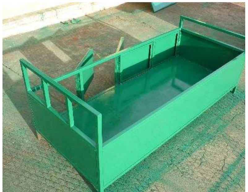
...das einmal ein Bett werden soll.