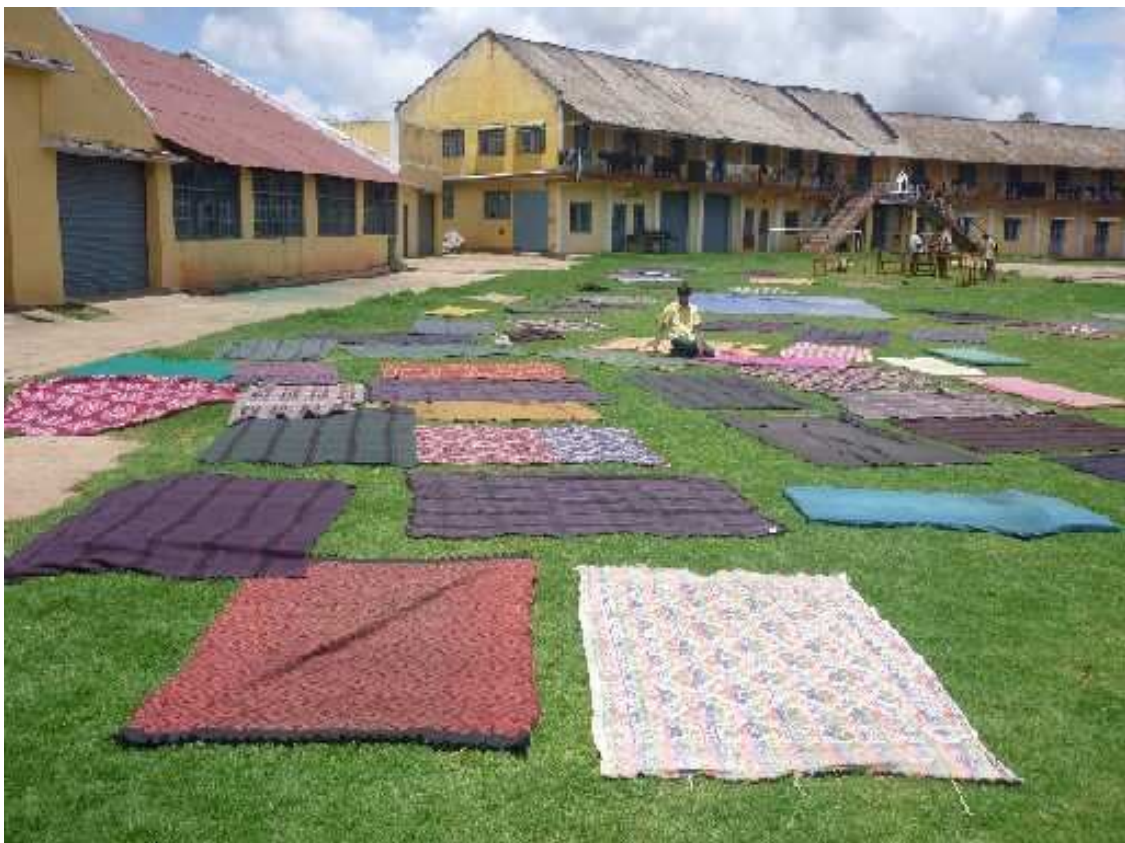
Ein sonniger Tag waehrend der Regenzeit bot sich zum Ausschuettern und ausgiebigen Sonnen der Hosteldecken an...

Wie die gesamte Arbeit der Chennai Mission ist auch diese Einrichtung motiviert durch Missstaende, die sich aus der indischen Gesellschaftsstruktur mit dem Kastensystem ergeben. Es ist kein Zufall, dass der groesste Teil der Schueler aus den untersten Gesellschaftsschichten und sehr armen Verhaeltnissen stammt. Die meisten von ihnen haetten keine andere Moeglichkeit, irgendeine Ausbildung zu bekommen, geschweige denn, diese auch noch zu bezahlen. Man kann sich daher denken, dass die Schule und das Wohnheim nicht aus (Schul-)Gebuehren zu finanzieren sind – viele Familien sind nicht in der Lage, die Beitraege fuer Hostel und Ausbildung aufzubringen und bezahlen entweder nur teilweise oder symbolisch.