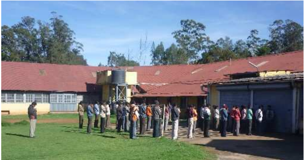
Gemeinsames Morgengebet vor Arbeitsbeginn. Ausserdem werden die wichtigsten Schlagzeilen aus der Zeitung vorgelesen.